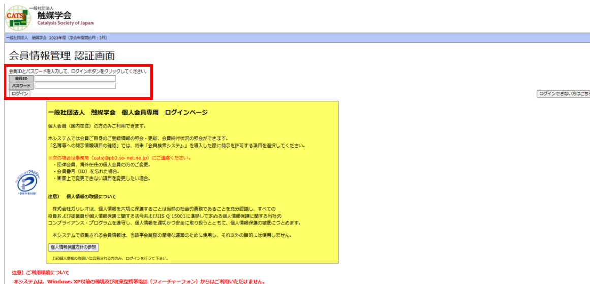
図 2. 会員情報管理 認証画面