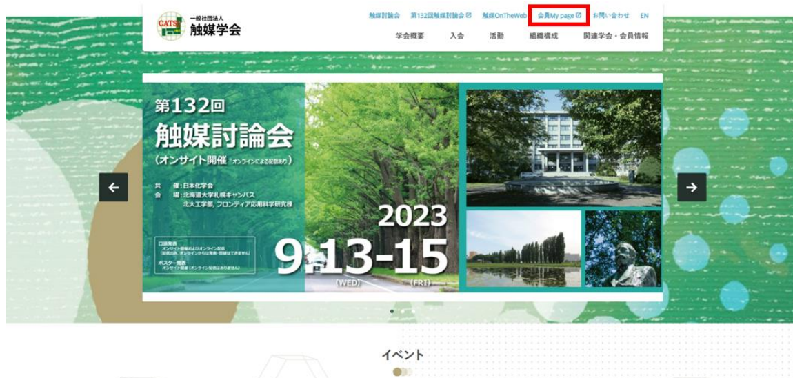
図 1. 触媒学会 HP のトップページ